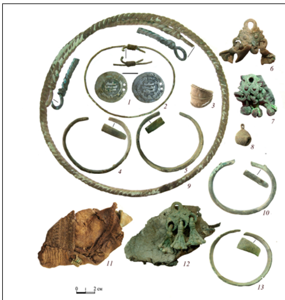
Рис. 2. Русенихинский могильник, инвентарь жертвенных комплексов 15 (1) и 14 (2–13): 1–6, 8–10, 13 — цветной металл; 7, 12 — кожа, цветной металл; 11 — ткань, кожа.

Мужские костюмы были менее декорированы металлическими украшениями, поэтому выделить слои труднее. Обычно они отмечены богатым поясным набором. В ряде случаев над поясом найдены серьги: жк 2, 8, 13 Русенихинского могильника. В жк 16 Выжумского могильника нагрудные украшения также находились над поясом.