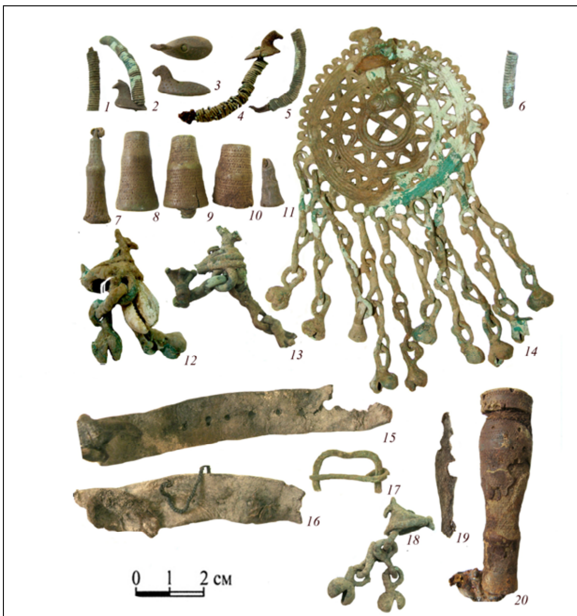
Рис. 3. Русенихинский могильник, инвентарь жертвенного комплекса 14: 1, 5, 6 — кожа, цветной металл; 2–4 — кожа, цветной металл, кость; 3, 7–11, 19 — кость; 12–14, 17, 18 — цветной металл; 15, 16 — кожа; 20 — кость, железо.

Заслуживает внимания находка из кургана № 11 могильника Катанда-3 на Горном Алтае. Этот объект представлял собой кенотаф с захоронением верхового коня и местом для погребения человека. В части могилы, предназначенной для человека, выше берестяного колчана, находился монолит из кожи, металлических изделий и шелка, принятый первоначально за остатки сумки. Позднее при разборе этого монолита был выявлен пояс, застегнутый вокруг свертка одежды [Мамадаков, Горбунов, 1997, с. 117, рис. 10].