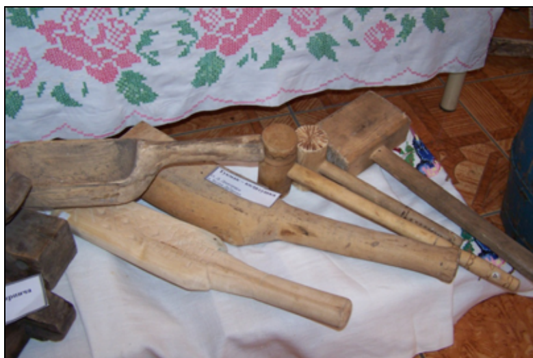
Рис. 2. Часть экспонатов выездной экспозиции «Музея чувашской культуры и быта», с. Канаш Нижнетавдинского р-на Тюменской обл., 2010 г.

В том же аспекте (репрезентации) выступает и сама экспозиция. Она весьма мобильна. Какая-то ее часть состоит из выездных экспонатов, которые выставляются на региональных праздниках различного уровня: от сельских национальных ( Акатуй , Сурхури ) до многонациональных областных («Мост дружбы», «Праздник плуга», фестиваль «Радуга» и др.).