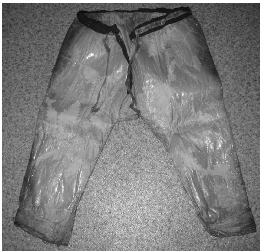
Рис. 2. Штаны для духа-покровителя, д. Тутлейм Березовского района, 2006 г.

Головные уборы представлены двумя суконными шапками, которые входят в комплекс жертвенных покрывал в категории «шлемы», были посвящены Вэрту [Гемуев, Бауло, 2001. С. 35–36].