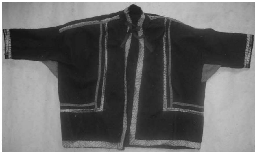
Рис. 8. Халат для духа-покровителя, д. Овагорт Шурышкарского района, 2006 г.

Халат из синего сукна имеет прямой силуэт, прямые и широкие рукава с квадратными ластовицами из желтого сукна (рис. 8). Полочки и спинка выкроены из одного куска сукна (без боковых швов), для пройм сделаны разрезы. К вороту пришит шалевый воротник, к которому спереди прикреплены пара завязок из полосок красного шелка. Края рукавов, воротника, полочек, подола обшиты полосой цветного ситца. Полосой этого же ситца обшиты плечевые швы, полочки и подол халата. Рядом с ней на плечи, полочки и подол нашита полоса желтого сукна. Длина халата достигает 37,5 см, ширина подола — 73,5 см, длина рукава — 12 см, ширина рукава — 8 см.