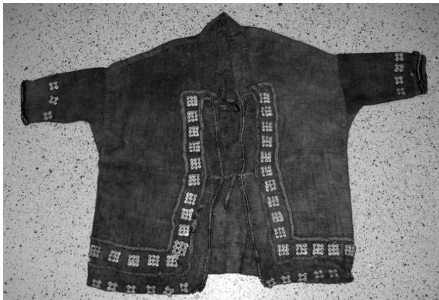
Рис. 1. Халат для духа-покровителя, д. Тутлейм Березовского района, 2006 г.