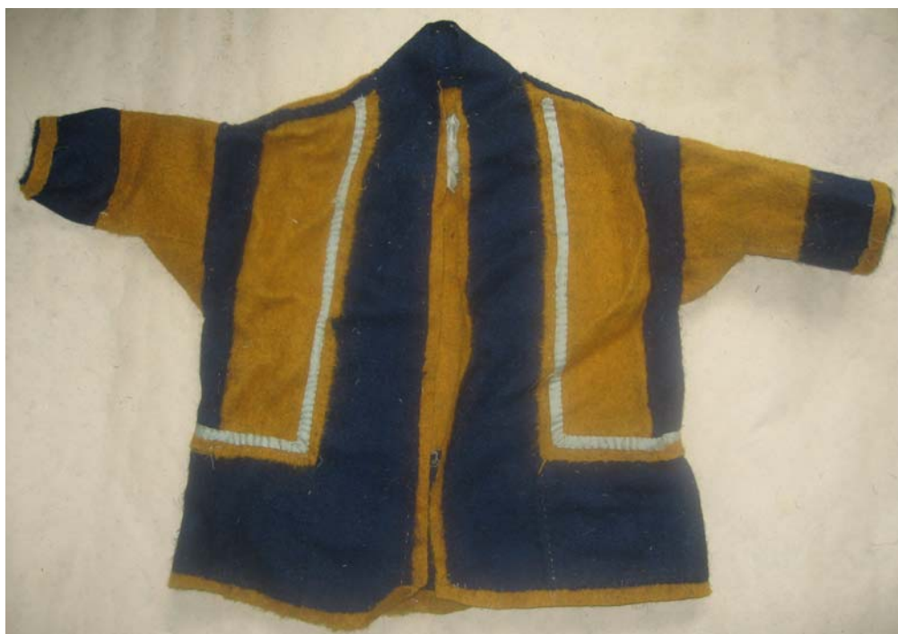
Рис. 9. Халат для духа-покровителя, д. Овагорт Шурышкарского района, 2006 г.

окантованы полочки и подол. С изнаночной стороны под воротник пришита монета. Длина халата составляет 40 см, ширина подола — 73,5 см, длина рукава — 13 см, ширина рукава — 8 см.