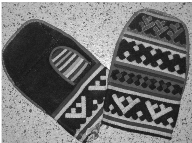
Рис. 4. Рукавицы для духа-покровителя, д. Тутлейм Березовского района, 2006 г.

гается горизонтальными бордюрами, на большом пальце — также горизонтальными полосами. Длина каждой рукавицы составляет 22 см, ширина — 13 см, длина большого пальца — 7 см, ширина — 5 см. Рукавицы могли быть сшиты во второй половине XX в.