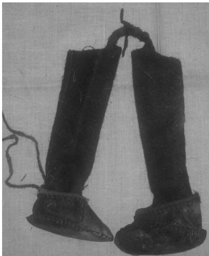
Рис. 7. Кожаная обувь с чулками для духа-покровителя, д. Хорьер Шурышкарского района, 2006 г.

Чулки из зеленого сукна имеют башмаковидный тип кроя. К краю передней части голенища пришиты завязки из полосок красного сукна. Длина голенища составляет 16,5 см, ширина голенища — 7 см, длина подошвы — 9,5 см, ширина подошвы — 15,5 см. Чулки, так же как и кожаная обувь, были сшиты в середине XX в.