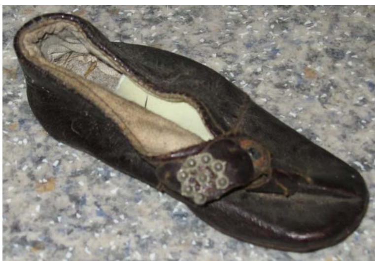
Рис. 3. Обувь для духа-покровителя, д. Тутлейм Березовского района, 2006 г.

Пара обуви имеет башмаковидный покрой без голенища и состоит из подошвы и головки. Подошва сделана из ровдуги, головка — из кожи. По краю головки пришита кулилка из хлопчатобумажной ткани. Обувь обвязана сверху шерстяной ниткой красного цвета. Длина подошвы составляет 5 см, ширина подошвы — 1,8 см, высота головки — 2,5 см. В обувь были вставлены чулки.