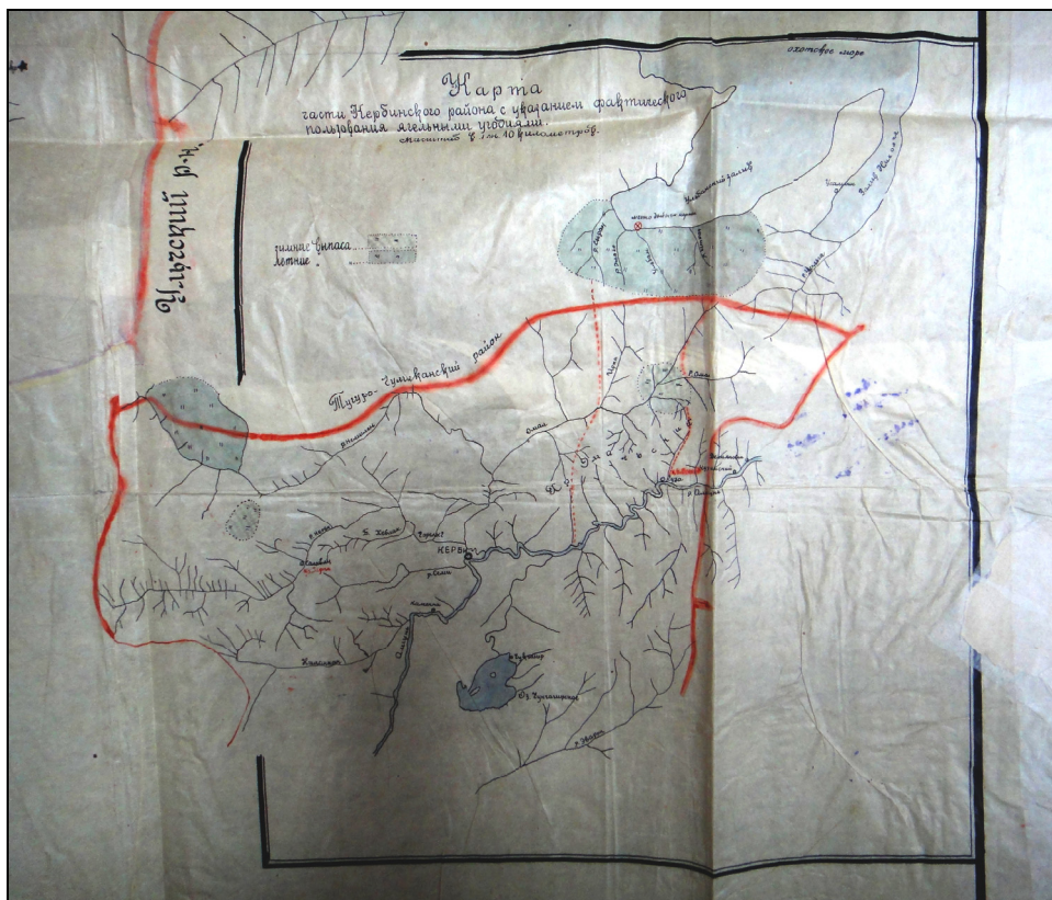
Рис. 3. Схематическая карта Кербинского района с указанием фактического пользования ягельными угодьями, 1937 г. Документ Муниципального архива Николаевского района. Ф. 12. Оп. 1. Д. 51. Л. 112. Фото Л.И. Миссоновой, 2015 г.

тельно можно отнести ко II–VIII вв. н.э., а взаимовлияние этнокультурных систем Якутии и Дальнего Востока фиксируется с неолита [Алексеев, 1996; Бравина, 2014, с. 226]. Основываясь на исторических преданиях и археологических изысканиях, Р.И. Бравина выявляет факты существования в XVI–XVIII вв. межэтнической брачной связи дюпсинских, мегинских и усть-алданских якутов с тунгусскими родами [Бравина, 2015]. Причем речь идет о тунгусских общностях как Китая (с земли Тонгус Молды), т.е. находящихся на Амуре к востоку от Якутии, так и самого побережья Охотского моря. На протяжении веков создается уникальный синтез кочевых культур, благодаря которому происходит активное расширение границ освоенных северных пространств. Можно заметить также, что тунгусской культуре было суждено вторичное познание и освоение коневодства (уже при оседлом образе жизни) именно при тесном хозяйственно-культурном контакте с якутской скотоводческой традицией.