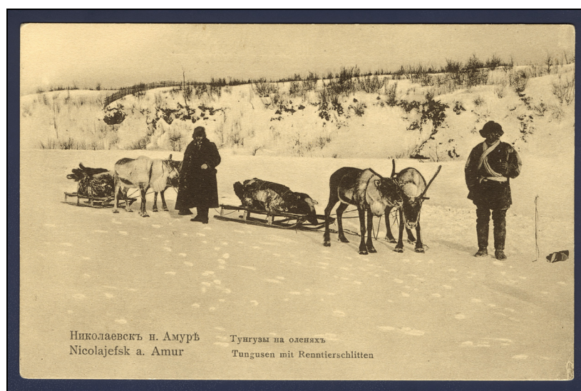
Рис. 2. Фотооткрытка «Тунгузы на оленях». Николаевск-на Амуре, начало XX в. Fig. 2. Photo card “Tungus on deer”. Nikolaevsk-on-Amur, the beginning of the 20th century.

Продвижение по рекам. Активизация продвижения тунгусских этнических общностей в процессе жизненно необходимого освоения пространства происходила в первую очередь по речным артериям ДВ. Освоение пространства именно системы рек — это характерная особенность тунгусских народов. При этом хорошо известно, как тщательно использовалось все возможное пространство и крупных рек, и самых мелких притоков. Весь жизненный цикл тунгусских общностей происходил в речном ландшафте (подробнее см.: [Ермолова, 2007; Лаврилье, 2010]). Расселение по рекам до сих пор служит тунгусским кодом родства в многопоколенной памяти. Образ реки отражен как в традиционном для прошлых веков орнаменте, так и в современном прикладном искусстве.