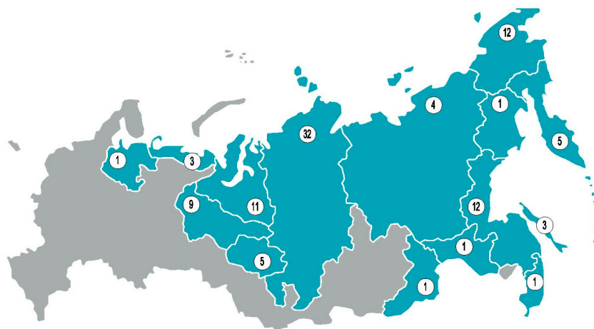
Рис. 2. Территория проведения полевых исследований по данным докладных записок (1956–1994). Fig. 2. The area of field research according to the data of reports (1956–1994).