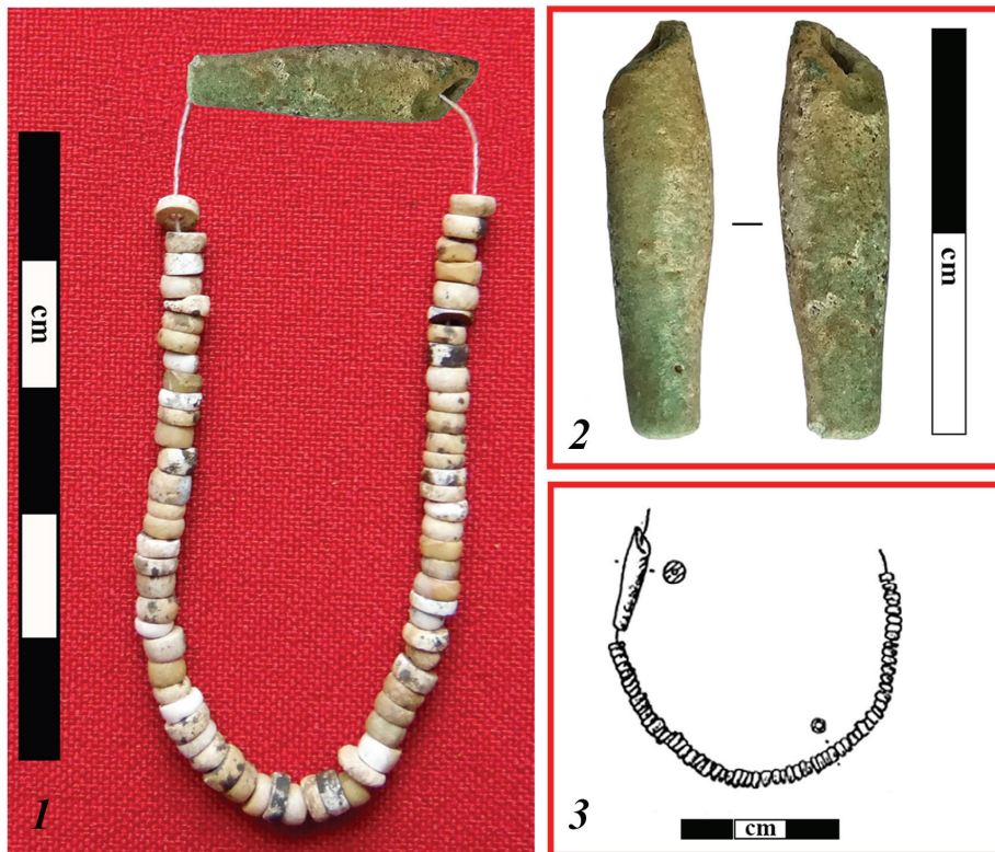
Рис. 1. Браслет из могилы № 16 памятника Телеутский Взвоз-I:

В композиции браслета выделяется светло-зеленая обойма биконической формы (рис. 1, 2). Длина ее сохранившейся части составляет 21 мм, один край немного обломлен. Обойма имела наибольший диаметр в центральной части (около 6 мм), а у целого края — 3,5 мм. Имеется просверленное продольное отверстие диаметром 1,5 мм. С одной стороны обойма покрыта коркой белой патины. Веревка, соединявшая воедино элементы браслета, не сохранилась.