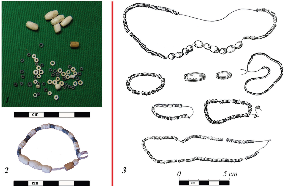
Рис. 3. Типологически близкие браслеты из материалов памятников Гонур-Депе (Туркменистан) и Черновая-VIII (Восточная Сибирь):

1, 2 — каменный бисер и обоймы из погребения в цисте 4167 раскопа № 8 памятника Гонур-Депе и реконструкция браслета (публикуется с разрешения Маргианской археологической экспедиции); 3 — каменный бисер и обоймы из могильника окуневской культуры Черновая-VIII (по: [Вадецкая и др., 1980]).