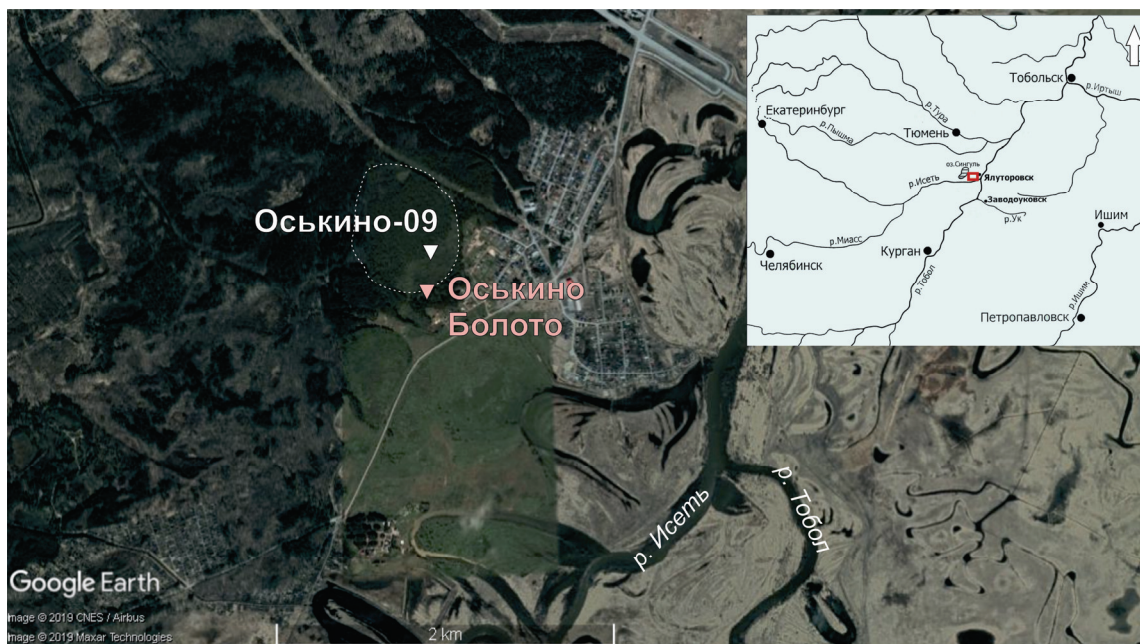
Рис. 1. Район исследования, местоположение торфяника Оськино-09 и многослойного поселения Оськино Болото.

ловину овальной формы площадью около 70 га на краю второй левобережной террасы Исети, со стоком в сторону ее поймы. Северо-западная часть котловины занята олиготрофным торфяником, заросла березой и угнетенной сосной. Однако в юго-восточной части все еще идет мезотрофное торфонакопление, участок почти без деревьев и покрыт хвощево-вахтовой, с примесью белокопытника, растительностью и единичными кустами ивы. Именно в этой, по-видимому, более глубокой части котловины отобрана колонка проб. Краевые участки торфяника сильно обводнены и покрыты тростником, пушицей и рогозом.