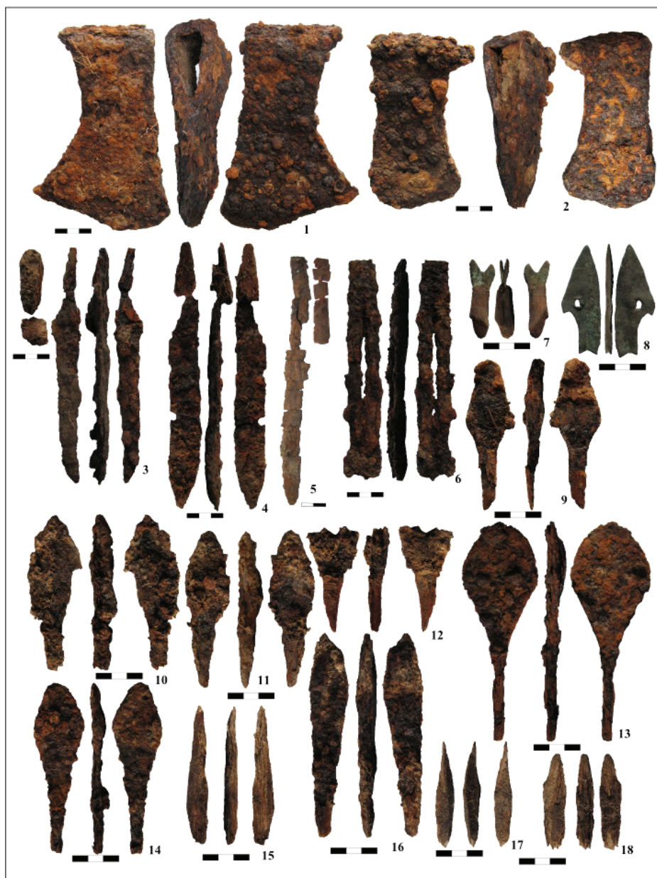
Рис. 2. Инвентарь из могил:

1, 2 — топоры; 3 — нож и остатки рукояти; 4 — нож; 5 — нож и остатки накладок на рукоять; 6 — кресало; 7 — наконечник стрелы с остатками древка; 8 — изделие из меди в виде наконечника стрелы; 9–12, 15–18 — наконечники стрел из скопления (погр. 2); 13, 14 — наконечники стрел: 5 — погр. 1; 1, 4, 6–12, 15–18 — погр. 2; 2, 3, 13, 14 — погр. 3; 7, 8 — медь; 15, 17, 18 — кость, остальное — черный металл.