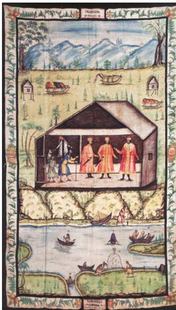
Рис. 1. Н. Шахов. «Обдорской князь и самоедские старшины» (рис. опубл.: [Терюков, 2004, с. 56]).

шейным платком, малиновом кафтане и шапке-конфедератке, за поясом заложен кортик с рукоятью, увенчанной головой хищной птицы. Наряд соответствует описанию парадного костюма обдорского князя, подаренного ему Екатериной II. Художественный образ князя не противоречит авторскому текстовому представлению. «Нынешний князь Тайшин,— пишет Белявский,— роста хотя малого, но статен, лицом не так дурен... белокур, бороды не носит, сложения довольно крепкого, природного ума имеет очень много, чрезвычайно горд, самолюбив и скуп до крайности» [1833, с. 84]. Под портретом князя помещен рисунок «Обдорская крепость», на котором изображен разрезанный двумя обскими притоками высокий берег Оби на фоне Полярного Урала; на одном из берегов-возвышенностей стоит русский город-крепость с церквями, а по окрестностям рассыпаны юрты. В отличие от остяцкого князя Тайшина самоедский старшина Пайгол (Пайвол Нырмин) изображен в полный рост в меховых одеждах — накидке (?), малице с поясом, расшитым металлическими бляшками, кисах и с костяной трубкой в руке. Текстовое описание главного самоедского старшины не в полной мере соответствует портрету, на котором изображен сравнительно молодой человек с усами и бородкой: «Пайгол... роста среднего, ему с лишком 90 лет, сед, но, несмотря на лета, очень крепок и здоров» [Белявский, 1833, с. 171].