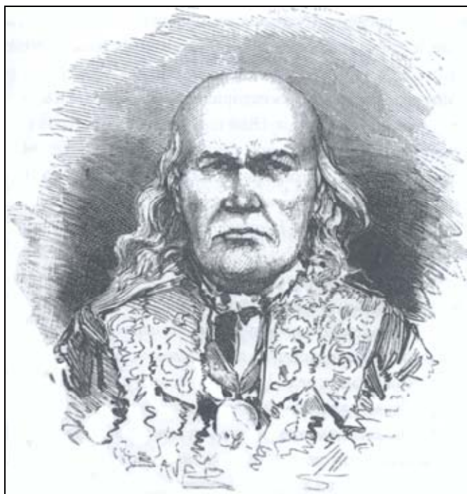
Рис. 2. Князь Тайшин (рис. опубл.: [Соммье, 2012, с. 303]).

принял путешествие в Санкт-Петербург (1854) и удостоился чести быть принятым при дворе императора Николая I, с него был написан портрет (местонахождение неизвестно. — Е. П. ). Во время личной встречи исследователя с обдорским князем последний не позволял ни рисовать себя, ни даже сделать антропологические измерения в обыденном костюме, а предпочел переодеться в «княжеские» одежды (рис. 2) [Соммье, 2012, с. 304, 305]. Три литографии, представляющее туземную элиту Западной Сибири XIX в., включены в немецкое издание трудов М.А. Кастрена. На одной из них изображен сидящий в кресле обдорский князь в парадном камзоле («Iwan Taischin»), на двух других — самоедские и североостяцкие старшины (групповые портреты «Noje Kobulin. Iwan Chudin. Lakurei. Tajundoma Chudin» и «Iwan Chudin. Nain Chudin. Kilim Malikow») [Castren, 1856].