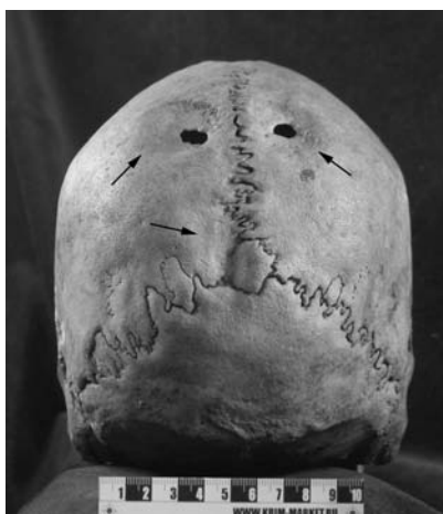
Рис. 3. Череп № 7985.

Череп 7985 (рис. 3–5) принадлежал мужчине 20–25 лет с о. Лифу, происходит из коллекции Cailliot, в Музей Человека был передан в 1884 г.