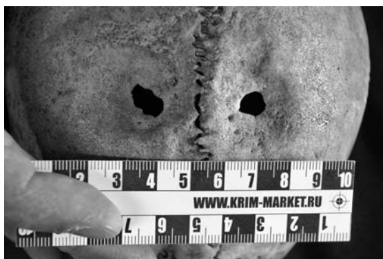
Рис. 4. Череп № 7985. Симметричные дефекты в районе теменных отверстий.

Венечный шов почти полностью зарос, за исключением участка в районе брегмы. Сагиттальный и ламбдовидный швы открыты, кроме небольшого участка в районе лямбды, о котором будет сказано далее. На чешуе лобной, теменных и затылочной костей выявлены специфические изменения кортикального слоя, напоминающие рисунок апельсиновой корки.