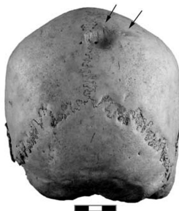
Рис. 6. Череп № 8018.

Череп № 8018 (рис. 6, 7) принадлежал женщине 30–35 лет с о. Лифу, в музей поступил из коллекции Cailliot, в Музей Человека был передан в 1884 г. В задней части правой теменной кости, в районе питательного отверстия, выявлен дефект в виде округлого чашеобразного углубления, заканчивающегося небольшим отверстием в полость черепа. Верхняя граница (22×24 мм), значительно больше внутренней (4×2 мм). Внутренняя поверхность дефекта имеет признаки резорбции и новообразования костной ткани. Следы выраженной васкулярной реакции свидетельствуют, что на момент смерти индивида эти процессы не завершились. К латеральному краю дефекта примыкает округлая область размером 10×7 мм, также со следами продолжавшихся на момент смерти индивида процессов резорбции кортикального слоя кости. Кроме того, кортикальный слой чешуи лобной и теменных костей имеет признаки васкулярной реакции, сопровождавшейся новообразованием костной ткани.