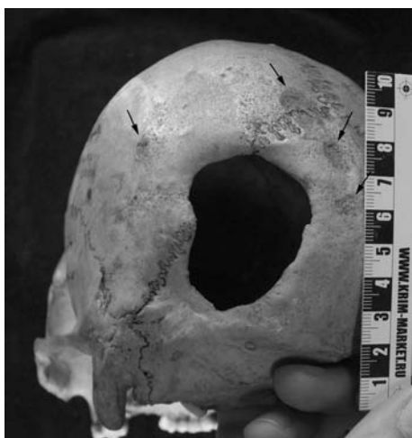
Рис. 2. Дефекты на черепе № 1524. Увеличение.

В левой части чешуи затылочной кости выявлен обширный дефект черепа в виде крупного отверстия (рис. 2) неправильной овальной формы размерами 53×41 мм по наружной пластинке. Со стороны эндокрана размеры отверстия меньше, 43×34 мм. Дефект расположен в левой части чешуи затылочной кости, захватывает участок ламбдовидного шва и прилегающий к нему небольшой участок чешуи левой затылочной кости (рис. 1, 2). Наклон стенок отверстия к внутренней поверхности черепной коробки различны: нижний край отверстия, находящийся сразу над левой верхней выйной линией затылочной кости, — 30–40°; медиальная и латеральные края отверстия — 60–70°; верхний край отверстия, разделенный посередине ламбдовидным швом, — 50–55°. Края отверстия полностью зажили, сформировалась замыкающая пластинка, прикрывающая губчатое вещество, соединяющая на всем протяжении отверстия наружную и внутреннюю пластинки черепного свода, что соответствует выраженной реакции заживления по Й. Немешкери, А. Краловански и Л. Харзани (Nemeskeri J. et al.; цит. по: [Медникова, 2001, с. 46–47]) (рис. 1, 2). По оценке Д.Г. Рохлина, продолжительность жизни оперированного человека с подобной стадией заживления краев трепанации составляет не менее 2–3 лет [1965, с. 174].