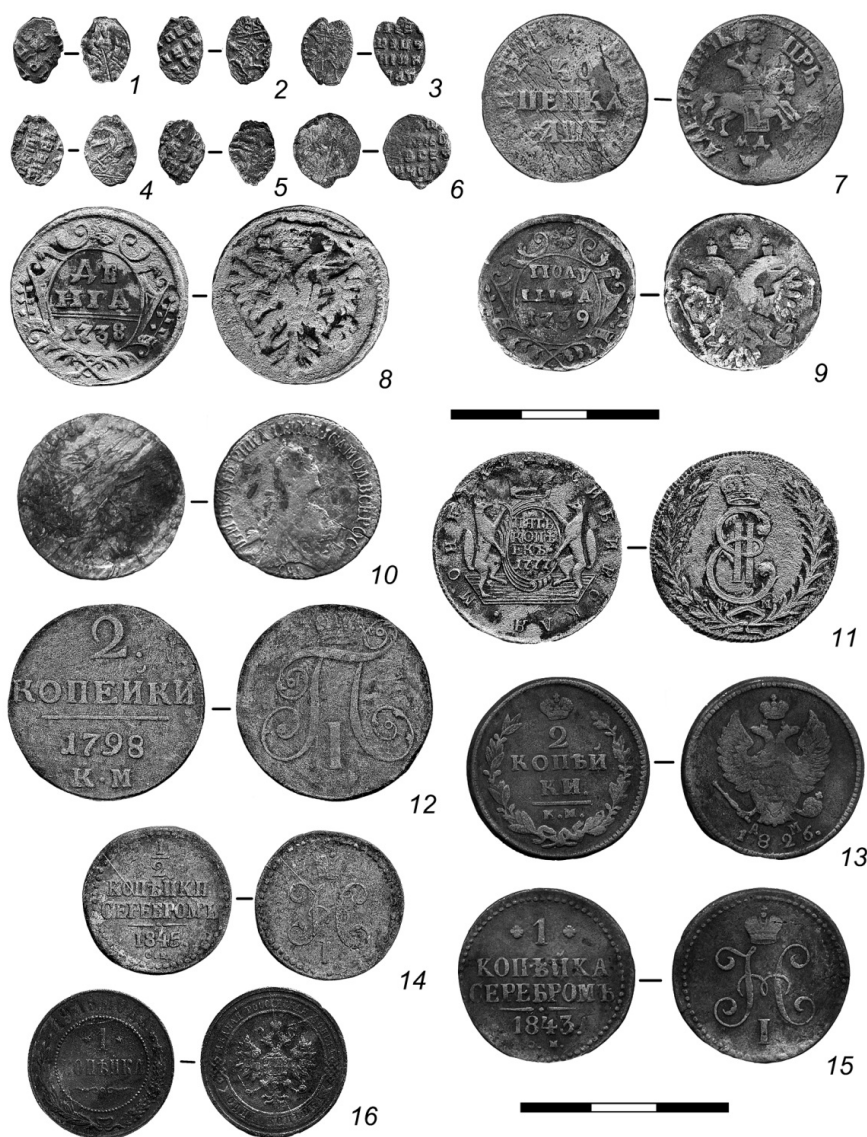
Рис. 1. Нумизматическая коллекция Базарного раскопа:

ях — полная легенда с названием учреждения, фамилии владельца, места размещения, а иногда и даты. Чрезвычайно интересно распределение пломб по категориям и наименованиям товаров и продуктов, которые производились в тех или иных населенных пунктах или вывозились из них, попадая затем на тобольский рынок.