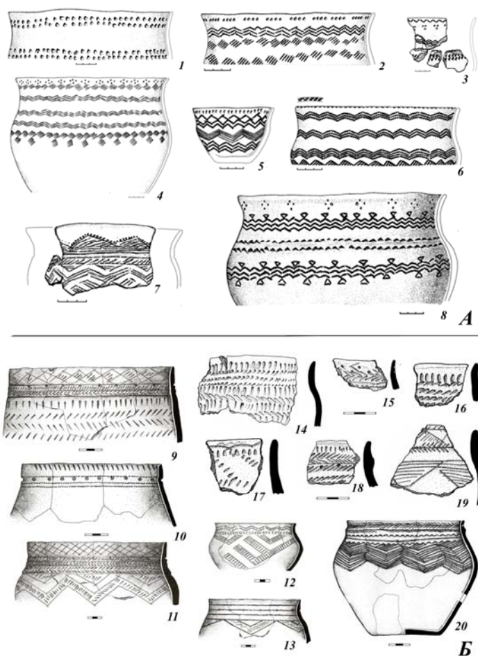
Рис. 2. Керамика коптяковской (А) и пахомовской (Б) культур: 1–8 — Чепкуль 5 [Зах и др., 2014]; 9–13 — Большой Имбирь 10 [Матвеев, Костомаров, 2011]; 14–19 — Тюрмитяки 3 (коллекция находится в музее ОмГПУ (поселение открыто Е.М. Данченко). Мы признательны за возможность обработки и использования данных материалов); 20 — Ук XIV (Ук 6).

Обратимся к анализу металлообработки указанных культур, что позволит отчасти охарактеризовать их экономику и установить направление культурных связей. С точки зрения исследования андронидных культур большой интерес представляет металл ташковских памятников. Коллектив авторов [Дегтярева и др., 2014] не только проанализировал все имеющиеся источники, но и дал оценку отрасли в целом. Особенностью ташковской металлообработки, по мнению авторов, являлась неустойчивость производственного процесса (эксперименты с температурами), наличие импортных предметов сейминско-турбинского типа [Там же, с. 21]. В целом характер обработки металла можно определить как периферийный, выраженный в подражании и неустойчивости технологии, отрасль базировалась на импорте из более развитых районов, орудия имели архаичный облик. Но главным, указывающим на связи ташковского населения, является вывод о том, что ташковские группы были вовлечены в круг производства, основанного на легированных сплавах, миновав стадию освоения меди [Там же, с. 23]. Учитывая принятую хронологию ташковских древностей и приведенные точки зрения, можно предположить, что в качестве поставщиков такого сырья выступали носители алакульских традиций, как наиболее вероятный партнер в импорт-экспортных отношениях.