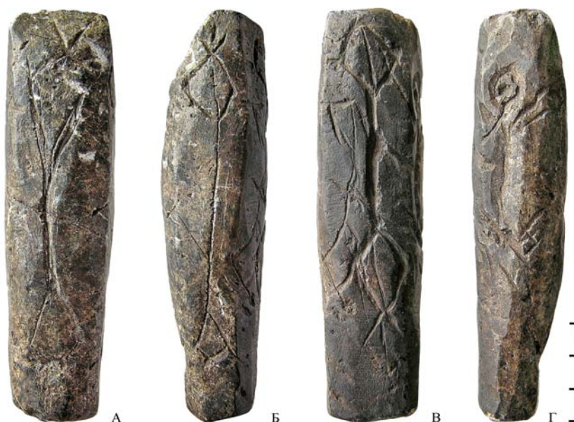
Рис. 2. Развертка изображений на гранях плитки из Синарского I городища (фото)

Двухплощадочное Синарское I городище было открыто Г.В. Бельтиковой в 1998 г. [Бельтикова, 2006, с. 38]. В 1999 г. она исследовала верхнюю площадку памятника (100 м 2 ). По сведениям автора раскопок, площадки Синарского I городища обживались многократно, с неолита до раннего средневековья. Однако культурный слой отложился в основном в раннем железном веке (гамаюнская и иткульская культуры).