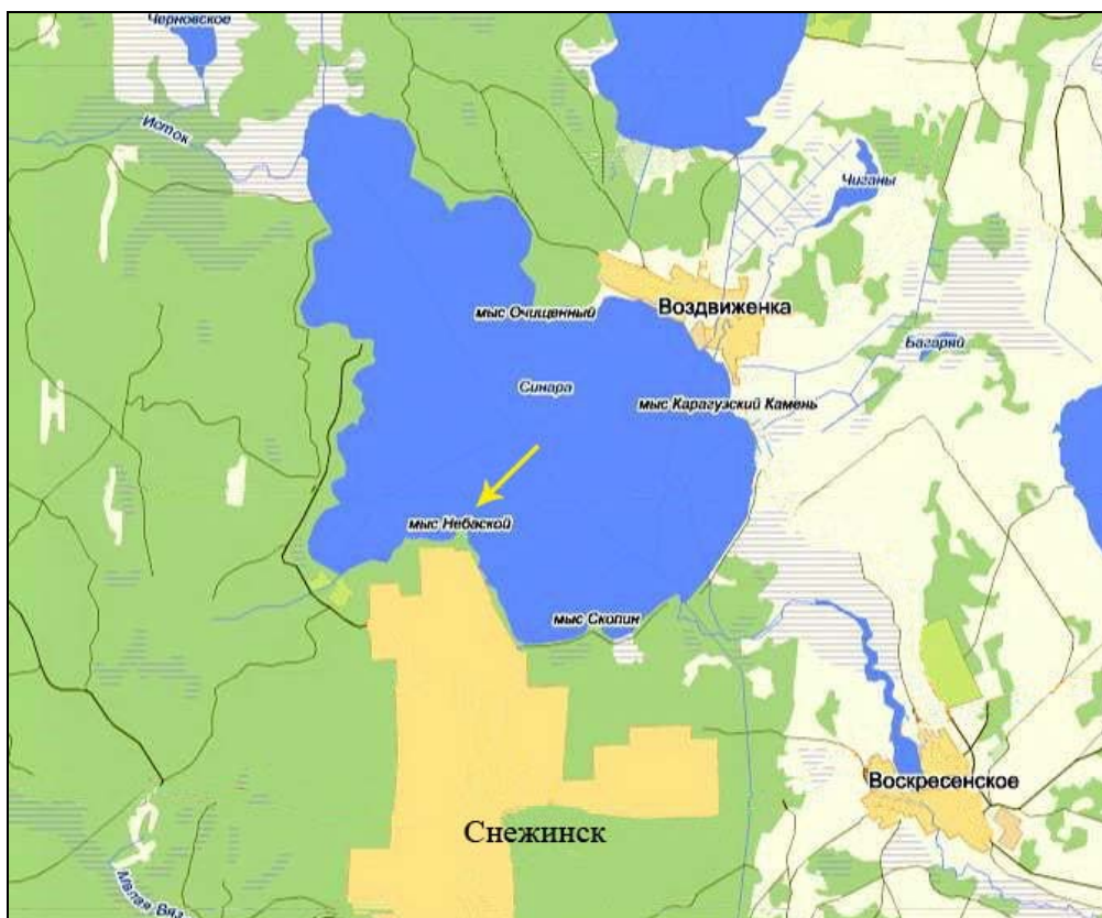
Рис. 1. Место расположения городища на мысе «Небаской» в черте г. Снежинска Челябинской обл.