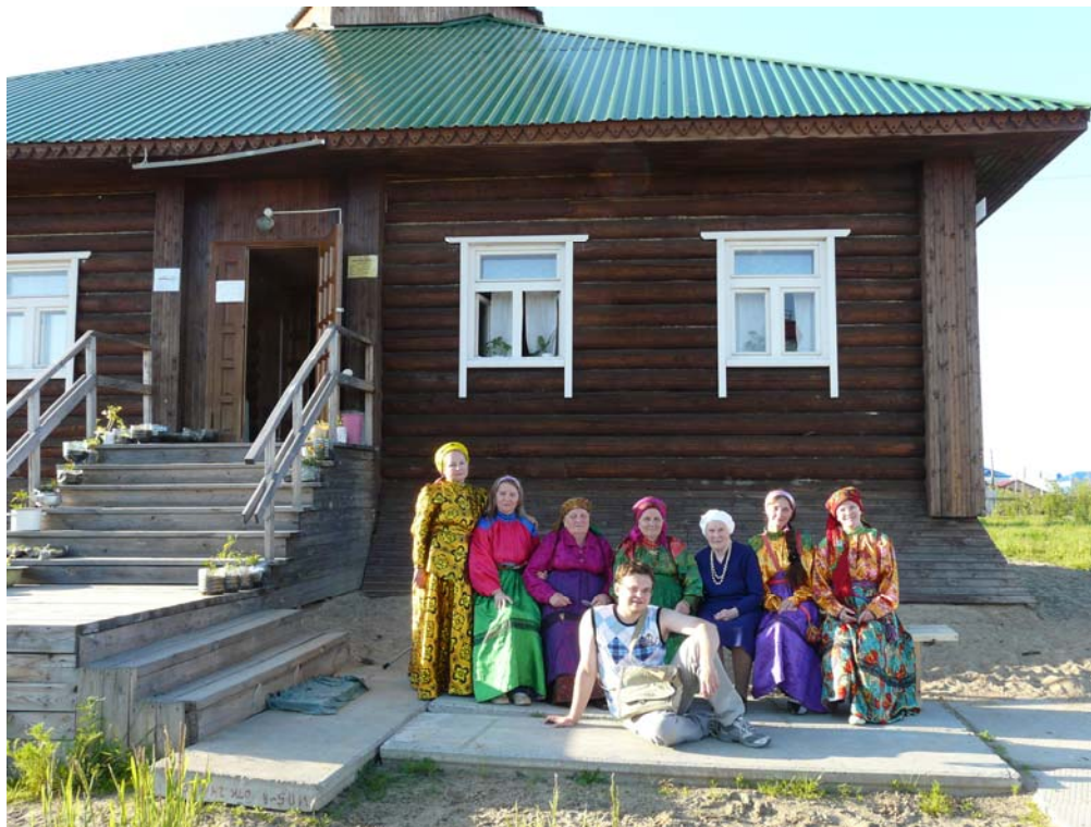
Рис. 6. Музей «Коми изба» в с. Мужы. Фото Н.А. Лискевич, 2009 г.

с. Мужы принимают активное участие в деятельности регионального общественного движения «Изьватас», которое занимается вопросами объединения коми-ижемцев, возрождением культурных ценностей, истории, традиций народа.