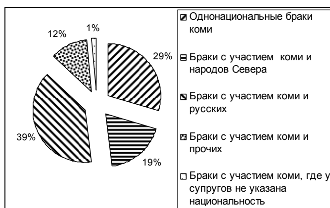
Рис. 3. Национальный состав браков с участием коми (%)

Брачное взаимодействие коми с Мужами. Показатели брачного взаимодействия коми отражают высокий уровень метисации — из 361 брака с участием коми 3 только 106 являются моноэтническими, 141 — с участием коми и русских (коми-русских — 65, русско-коми — 77), 67 — с участием коми и народов Севера (коми-ненецких — 10, коми-ханты — 42, коми-манси — 1, коми-селькупских — 1, ненецко-коми — 2, ханты-коми — 11), с участием коми и прочих — 42, в 5 случаях у одного из супругов национальность не указана (рис. 3). В 138 случаях в смешанные браки вступили мужчины, в 119 — женщины.