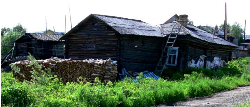
Рис. 5. Дом коми в с. Мужы по ул. Гагарина, 2. 1940-е гг. Фото Н.А. Лискевич, 2009 г.

В настоящее время в Мужах почти не осталось традиционных построек, сохранились только два жилых дома 1930-х и 1940-х гг. — по ул. Республики, д. 48, и ул. Гагарина, д. 2 (рис. 4, 5). Одной из достопримечательностей села и центров культурной жизни является музей «Коми изба», здание которого выстроено в традициях северно-русской архитектуры (рис. 6). В музее воссоздан традиционный интерьер избы коми, регулярно проводятся мероприятия, которые посещают как взрослые, так и дети. Хранителями этнокультурных традиций в основном выступают представители старшего поколения, которые владеют навыками традиционных ремесел, хорошо знают язык, до сих пор носят традиционную одежду. Ижемский диалект коми языка хорошо сохраняется на бытовом уровне, с конца 1990-х гг. стали регулярными теле- и радиопередачи на коми языке, в школе в факультативной форме стал преподаваться родной язык. В 1997 г. вышел букварь для коми-ижемского диалекта, разработанный местным специалистом, учительницей Овгортской школы Н.Д. Рочевой [Рочева, 1997]. В целях сохранения пропаганды культуры коми-ижемцев установлены регулярные связи между группами населения, носителями ижемского диалекта, проживающими в разных районах Севера и Ижемского района Республики Коми, выезжают самодеятельные художественные коллективы, происходит обмен научной и популярной литературой, газетными публикациями, различными делегациями. Коми жители