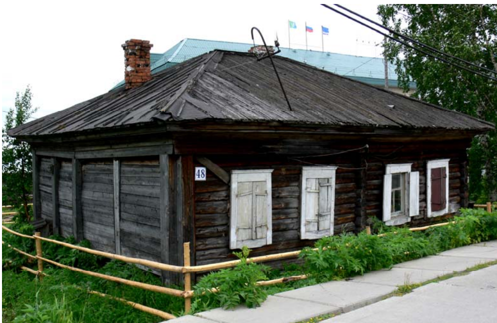
Рис. 4. Дом коми в с. Мужы по ул. Республики, 48. 1930-е гг.